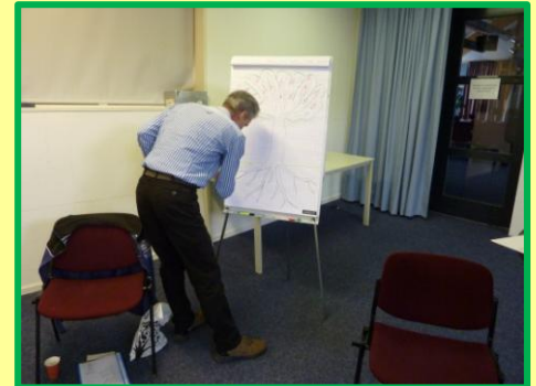
Visieseminar in Heerenveen